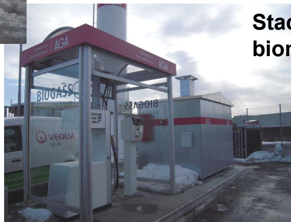
Stacja zasilania sprężonym biometanem