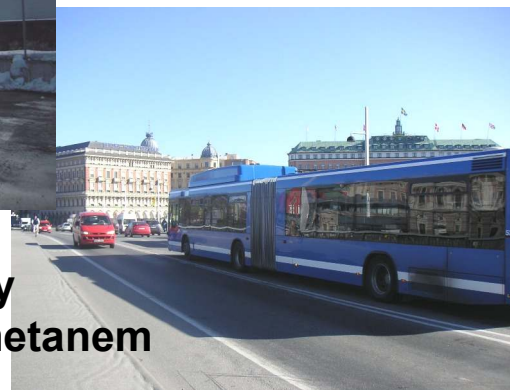
Autobus zasilany sprężonym biometanem