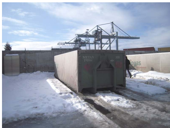
Kontener do przewozu sprężonego biometanu